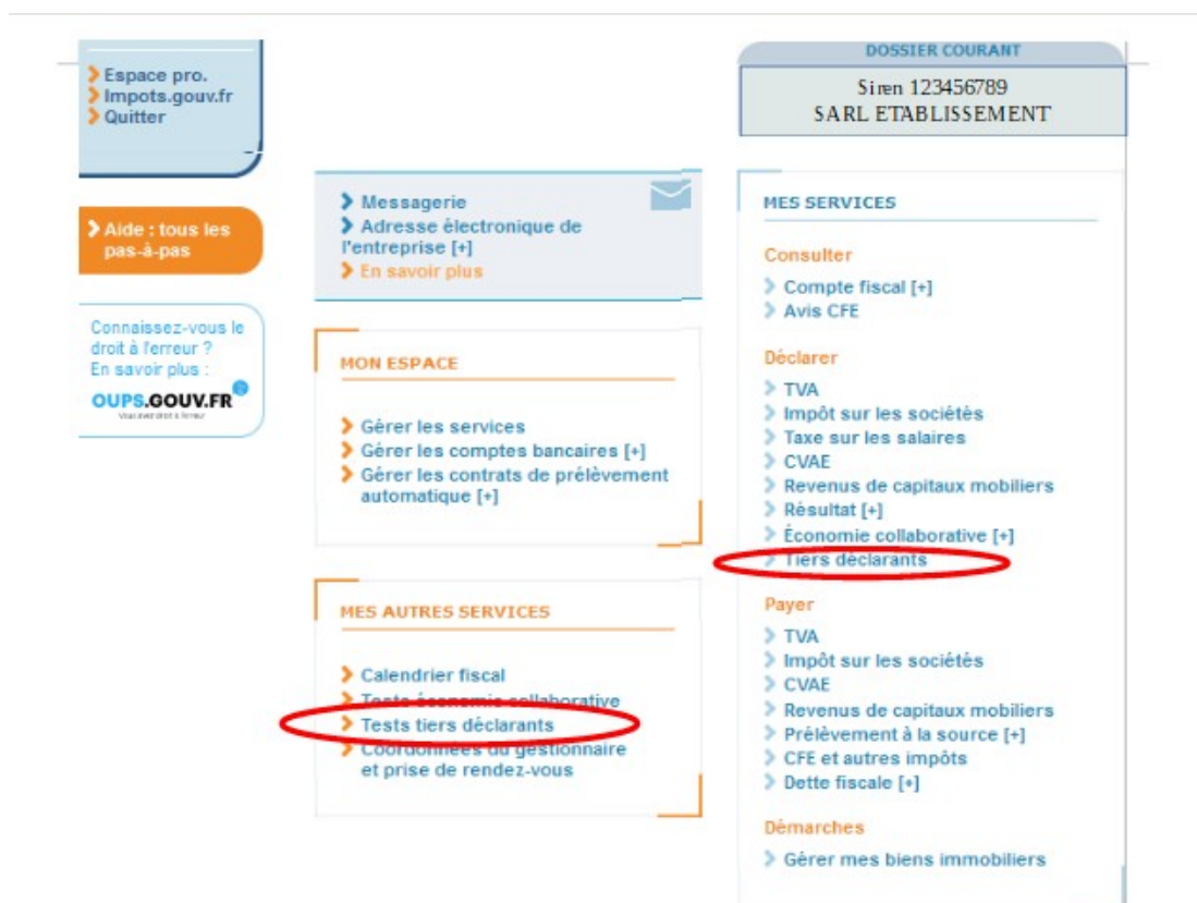
Illustration 2 : page de l'espace professionnel permettant notamment de visualiser les services disponibles. Ici, le service Tiers déclarants (cerclé en rouge, à droite), qui permet d'accéder au portail Télé-TD, est actif dans la rubrique « Déclarer ». L'accès à la plateforme de test (cf. 4.4 ci-après) est également accessible depuis cette page (cerclé en rouge à gauche).

L'ensemble de la documentation relative aux différentes opérations pouvant être réalisées dans l'espace professionnel est disponible sur la page dédiée du site impots.gouv.fr : Fiches focus sur les téléprocédures