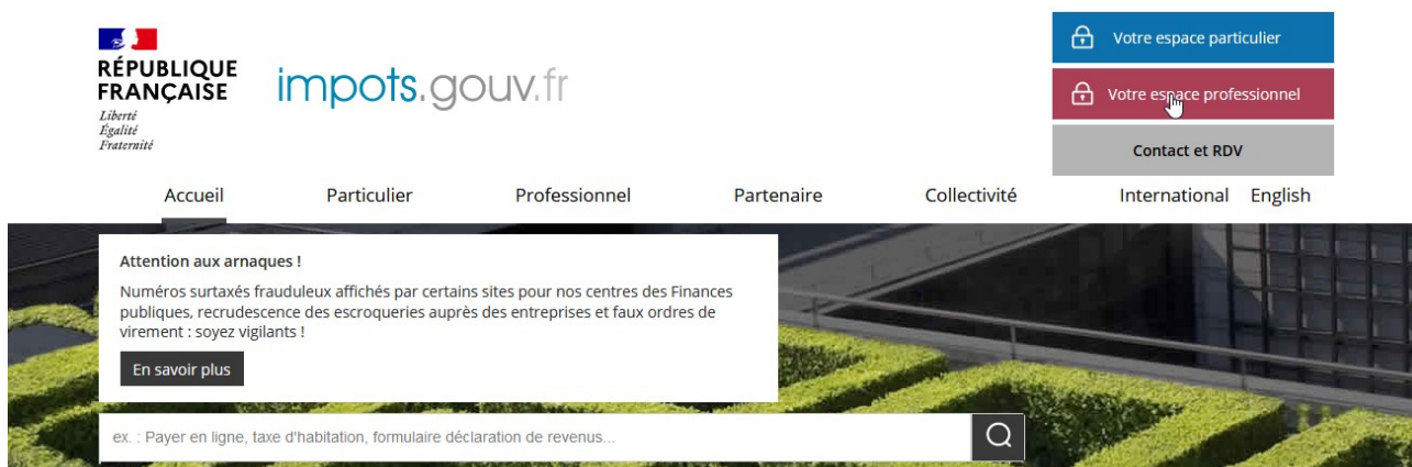
Illustration 1 : page d'accueil de l'Espace professionnel du site impots.gouv.fr ( https://cfspro.impots.gouv.fr/mire/accueil.do )

Cette étape doit être réalisée au titre du premier dépôt. Elle n'aura à être renouvelée pour les dépôts futurs, sauf si une autre personne physique, qui ne possède pas déjà d'un espace professionnel, est chargée de procéder au dépôt des fichiers en remplacement de la personne initialement désignée. L'espace professionnel est en effet lié à une personne physique en particulier et non pas l'entreprise pour le compte de laquelle une ou plusieurs de ces personnes physiques peuvent être autorisées à agir pour son compte sur le site impots.gouv.fr au nom de l'entreprise.