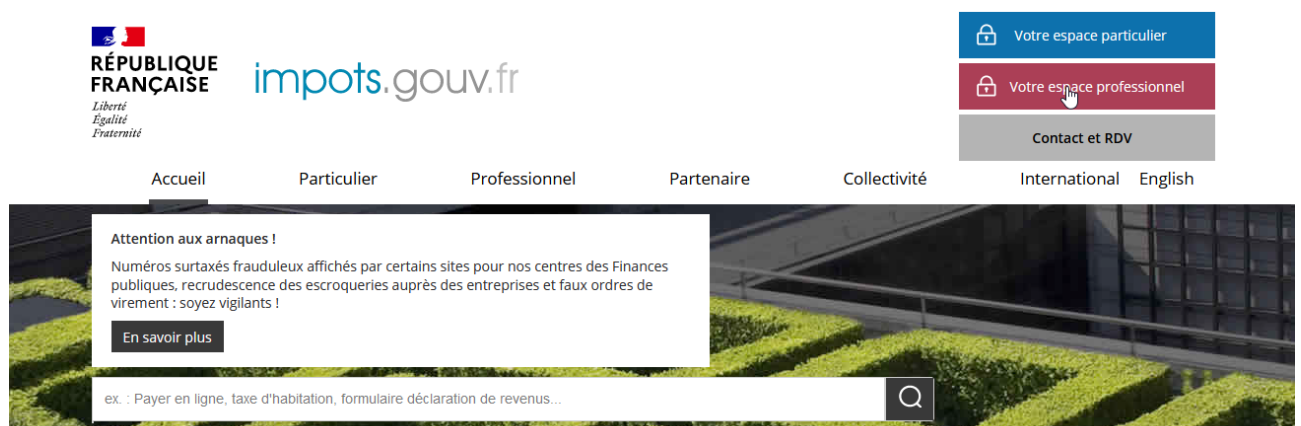
Illustration 1 : page d'accueil de l'Espace professionnel du site impots.gouv.fr ( https://cfspro.impots.gouv.fr/mire/accueil.do )

Cette étape doit être réalisée au titre du premier dépôt. Elle n'aura à être renouvelée pour les dépôts futurs, sauf si une autre personne physique, qui ne possède pas déjà d'un espace professionnel, est chargée de procéder au dépôt des fichiers en remplacement de la personne initialement désignée. L'espace professionnel est en effet lié à une personne physique en particulier et non pas l'entreprise pour le compte de laquelle une ou plusieurs de ces personnes physiques peuvent être autorisées à agir pour son compte sur le site impots.gouv.fr au nom de l'entreprise.